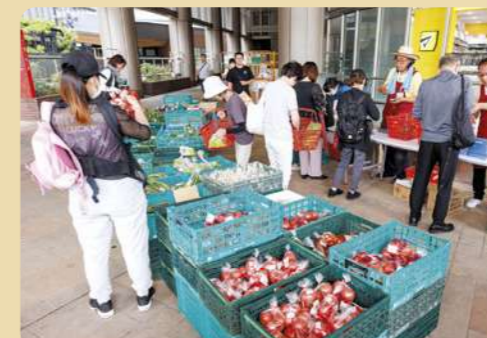
かわさきいまちマルシェ