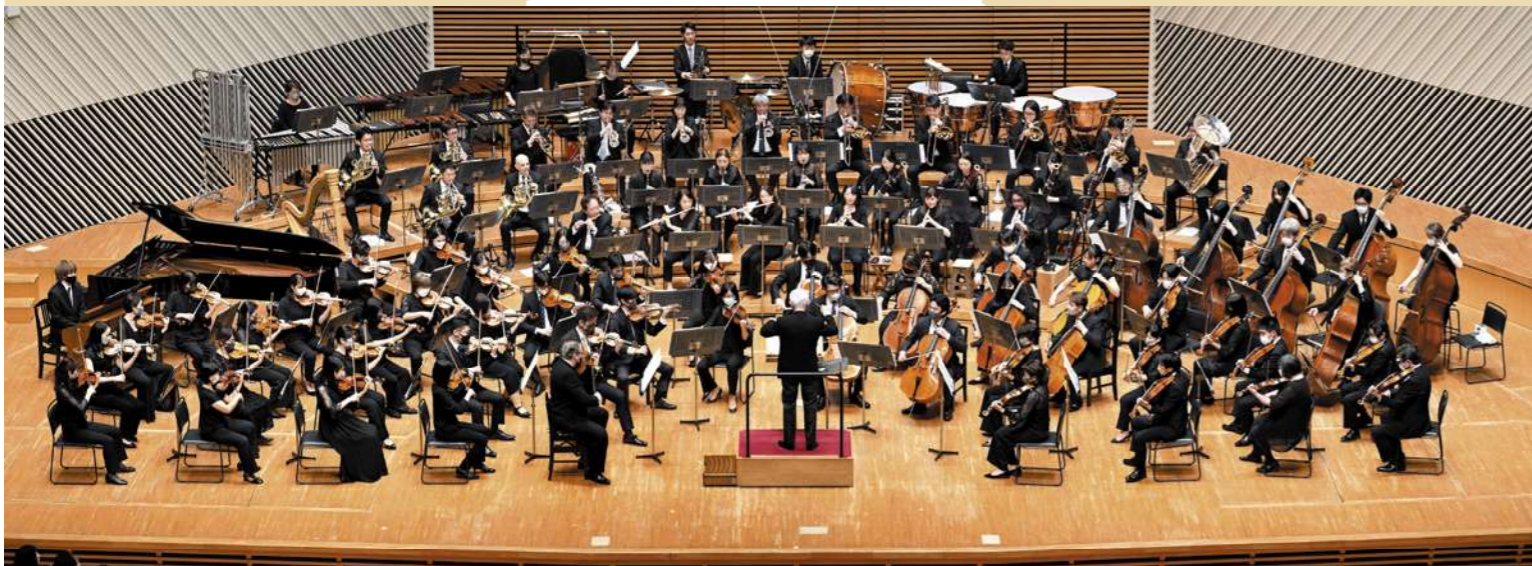
〔管弦楽〕東京交響楽団 Tokyo Symphony Orchestra 川崎市フランチャイズオーケストラ