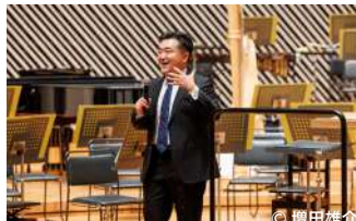
プレトークの様子。指揮の園田隆一郎が登場。

オペラを得意とする園田のコントロールは巧みで、埋もれがちなハーブや内声の動きもよくわかり、『蝶々夫人』第2幕間奏曲は聴きごたえ充分に構築。両歌手の歌に美しく絡む石田泰尚のヴァイオリン・ソロも特筆したい。(音楽ライター・林昌英)