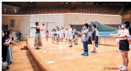
バロック・ダンスを体験