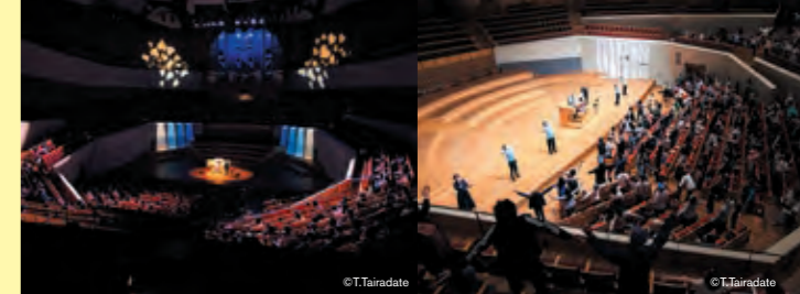
パイプオルガンミニコンサート&照明ショー