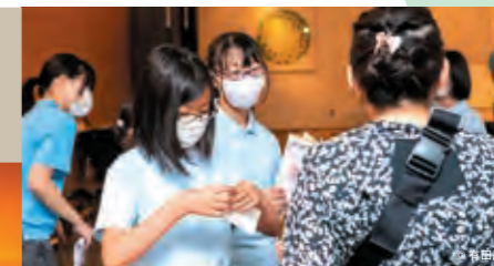
実際にお客様を案内