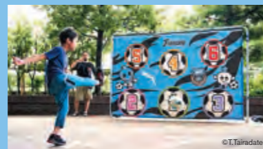
川崎フロンターレ presents キックターゲット