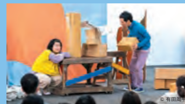
ENEOS presents 劇団風の子による「とかとか」上演

ENEOS presents 劇団風の子公演「とかとか」/JR東日本 presents JRトレインフェスタ/みんなの健康塾(川崎幸病院) presents 未来のドクター集まれ!/川崎フロンターレ presents キックターゲット/NEC レッドロケッツ presents サupertarget/音楽のまち・かわさき presents 手作り楽器ワークショップ/川崎浮世絵ギャラリー presents 缶バッジづくり/かわさきマイスター 食品サンプルづくり、染物体験/エミフルアクセサリーづくり/アナウンス体験/プログラミングワークショップ/川崎 いままちマルシェ/とれたて野菜直売市/川崎市市制100周年「白黒写真カラー化プロジェクト」ポスター展示/緑化事業 タネの配布/VRバーチャル体験