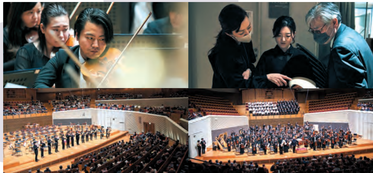
上：フェスティバルを通して各大学間の交流を図っている 下：大学毎の公演で披露される学生作曲のファンファーレ