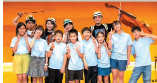
終演後に出演者と集合写真

ジュニア・プロデューサー2023企画公演 「だれでもハッピーコンサート～みんなの宝石 音の石～」 (7月1日「ミュザの日2023」にて開催)