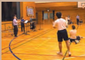
MUZA Presents クラリネットアンサンブル「四足歩行」コンサート

川崎市内で特別な支援を必要としている子どもたちの豊かな育ち、安全で安心な暮らしのために活動する団体が主催する夏休みのイベントで、ミュゼから音楽会をお届けしました。