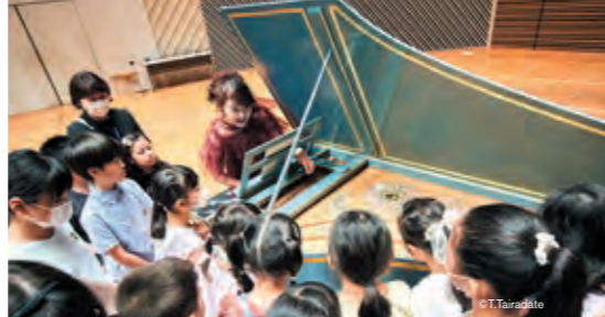
チェンバロの周りで見学

◎美しい楽器に触れられて、バロックダンスがどのようなものか知れて貴重な体験ができました。