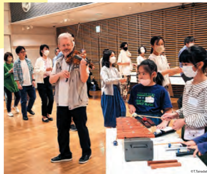
MUSIC×ENGLISH 音のワークショップ!