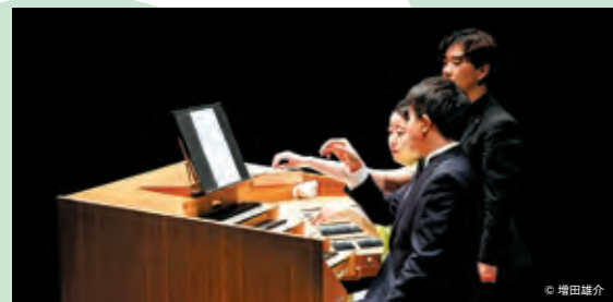
ランチタイムコンサートの様子