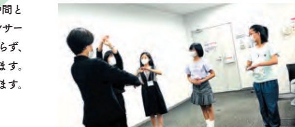
お客様のご案内研修