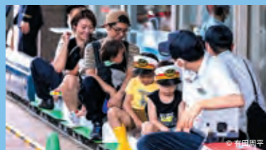
JR東日本 presents JRトレインフェスタ