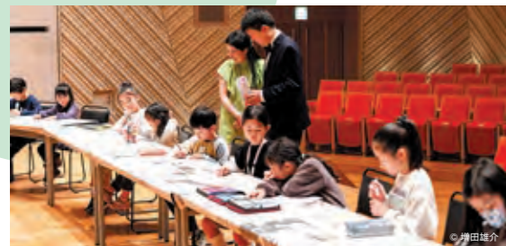
オルガンの響きを色で表現!