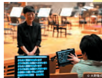
鑑賞サポートの様子