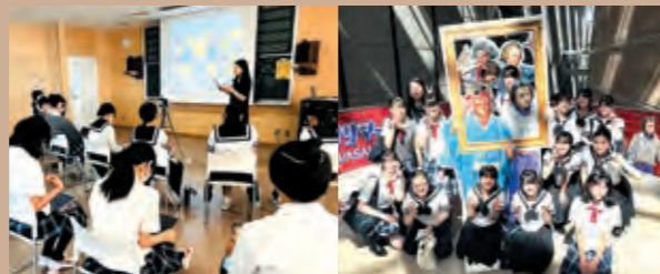
末場時に記念撮影

富士見中学校高等学校との共同企画で、3日間の夏期講習を実施しました。1、2日目は学校で対話型鑑賞を体験し、最終日はミュゼで公演を鑑賞しました。近年、学校教育は「地域とともにある学校」として学校外の教育資源と連携し、子ども達に豊かな教育機会を与えることを目指しています。ミュゼが持つノウハウや機会を活用し、より多くの方々へ豊かな音楽体験、教育を届けています。