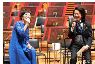
開演前のプレトークから。森山良子(歌)&渡辺俊幸(指揮・作編曲)