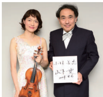
8月6日(日)東京交響楽団 昭和音楽大学テアトロ・ジューリオ・ショウワ

チャイコフスキーは好きな作曲家なので、とても楽しみに来ました。ヴァイオリン協奏曲を生で聴いたのは2回目ですが、すばしかったです。交響曲はどれも好きですが、5番を生で聴いたのは初めてで、こんなに迫力があるのかと驚きました。第4楽章の疾走感はすばらしく、迫力と感動で涙がでました。チャイコフスキーの魅力が存分に発揮されていたと思います。すばしかったです。(匿名) / ドラマチックな曲揃いです。オーケストラならではの魅力を楽しめる演奏でした。個人的には木管セクションが素晴らしいと思います。(匿名) / チャイコフスキーに浸れてとても楽しかったです(匿名)