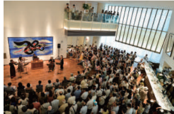
開演前、ロビーでの「オルガン・カフェ」風景から