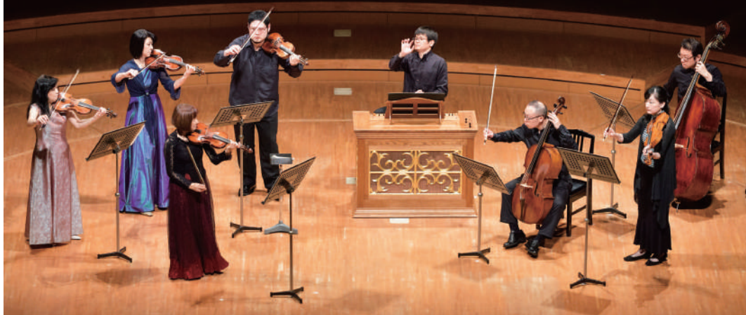
8月5日(土) 真夏のバッハII