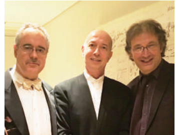
▲終演後の記念撮影 (左から) ルドヴィート・カンタ (チェロ)、井上道義 (指揮)、ティエリー・エスケシュ (オルガン)