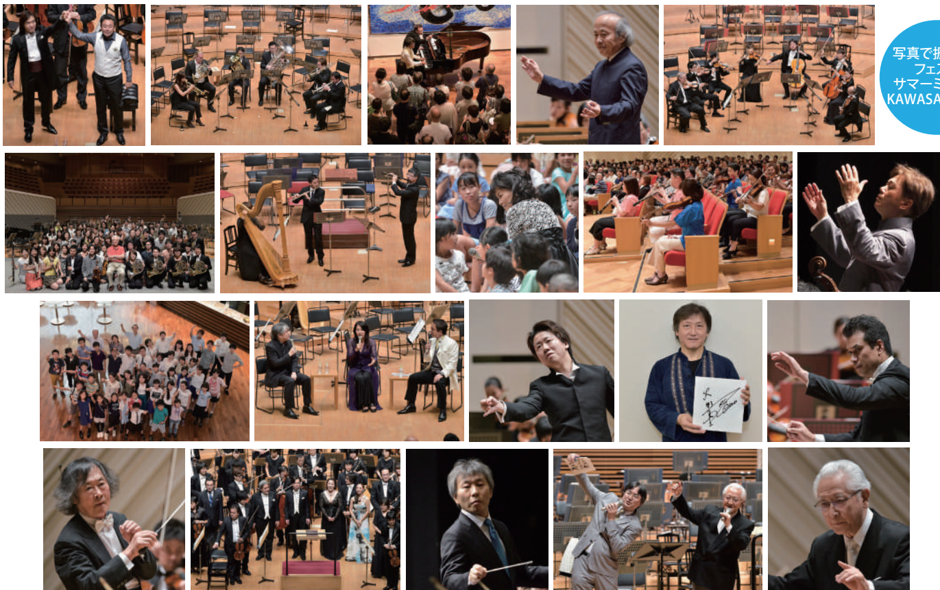
写真で振り返る フェスタ サマーミュージアム KAWASAKI 2015