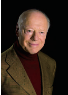
ベルナルト・ハイティンク