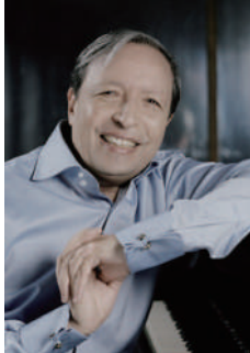
マレイ・ペライア