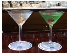
「マティニ」と「青い珊瑚礁」

夏の夜空を眺めながら、ふたりの話はジェットストリームのようにいつまでも続いた。大人の落ち着いたラウンジ、夏ぴったりのカクテルも楽しめます。(達)