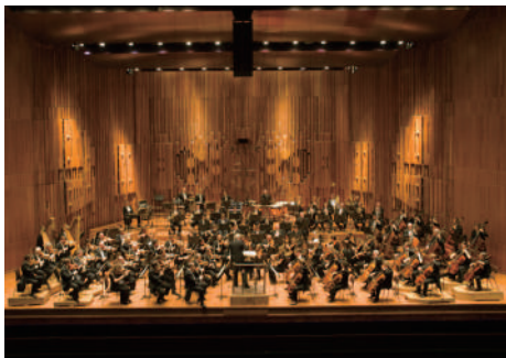
ロンドン交響楽団

ロンドン交響楽団は、優れた機能性とともなフレキシブルな音楽表現力を持つオーケストラである。ウィーン・フィルやベルリン・フィルのように際立って独自の響きと個性を追求するのではなく、練り上げられたアンサンブルを基調に、いかなる指揮者の要求にも柔軟に反応して多様な響きを作り上げる点に美質がある。実際、これまでも数々の名指揮者とともに数えきれないほど来日を重ねているが、常に指揮者の個性と解釈を高レベルで実現する演奏を聴かせてきた。筆者が思い出す来日公演でも、チェリビダッケの精妙な音響世界、アバドの知的かつ流麗な音楽性、ロストロポーヴィチの骨太な豪快ぶり、チョンの颯爽とした