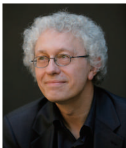
ベルナール・フォクルール