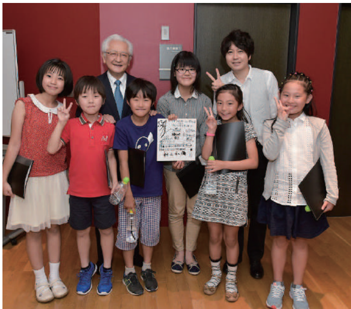
ミュージアの日ウェルカムコンサート 終演後、指揮者・秋山和慶さん、声優・堀江一真さんと朗読の子どもたち

7月1日はミュージア川崎シンフォニーホールの開館記念日、川崎市の市制記念日でもあります。市内の小中学校がお休みとなるこの日、ミュージアは川崎駅西口を盛り上げるお祭りを開催。その名も「ミュージアの日」。3回目となる今年も、JR「トレインフェスタ」や「ものづくり体験」などイベントを多数実施し、1万人を超える人々が詰めかけました。